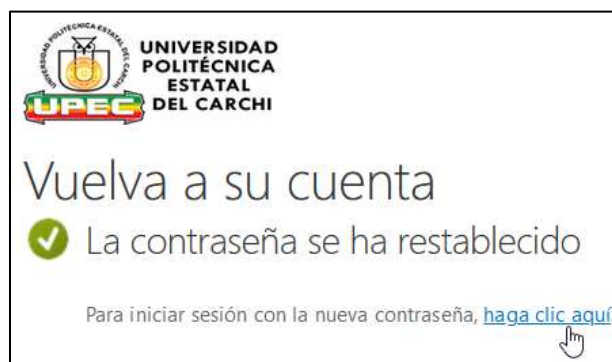
Figura A.7. Contraseña Creada