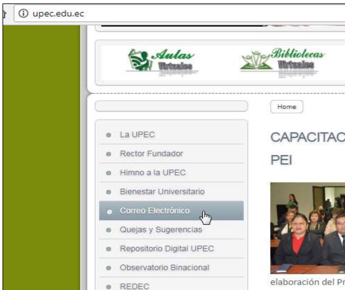
Figura A.1: Ingreso al correo institucional