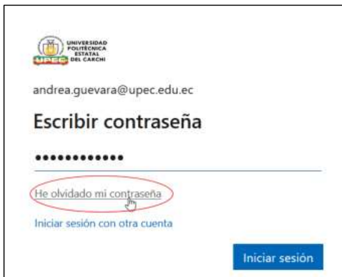
Figura A.2. Iniciar Sesión al correo para restablecimiento de contraseña